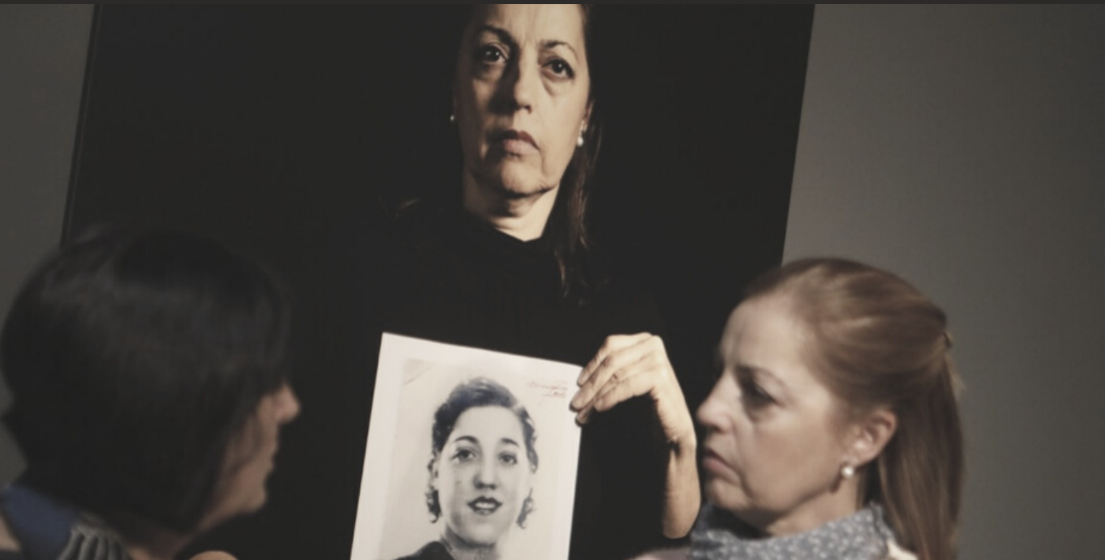
Fotografía de Pedro Lange-Churió para la exposición Duerma en ti (Centro del Carmen, Valencia, 12 de marzo-2 de junio, 2019).

Durante ese Estado de terror e impunidad que perduró décadas, con el dictador Francisco Franco al frente, se procedió a un plan sistemático de exterminio del sector perdedor e ideológicamente contrario al régimen franquista, provocando un macabro genocidio.