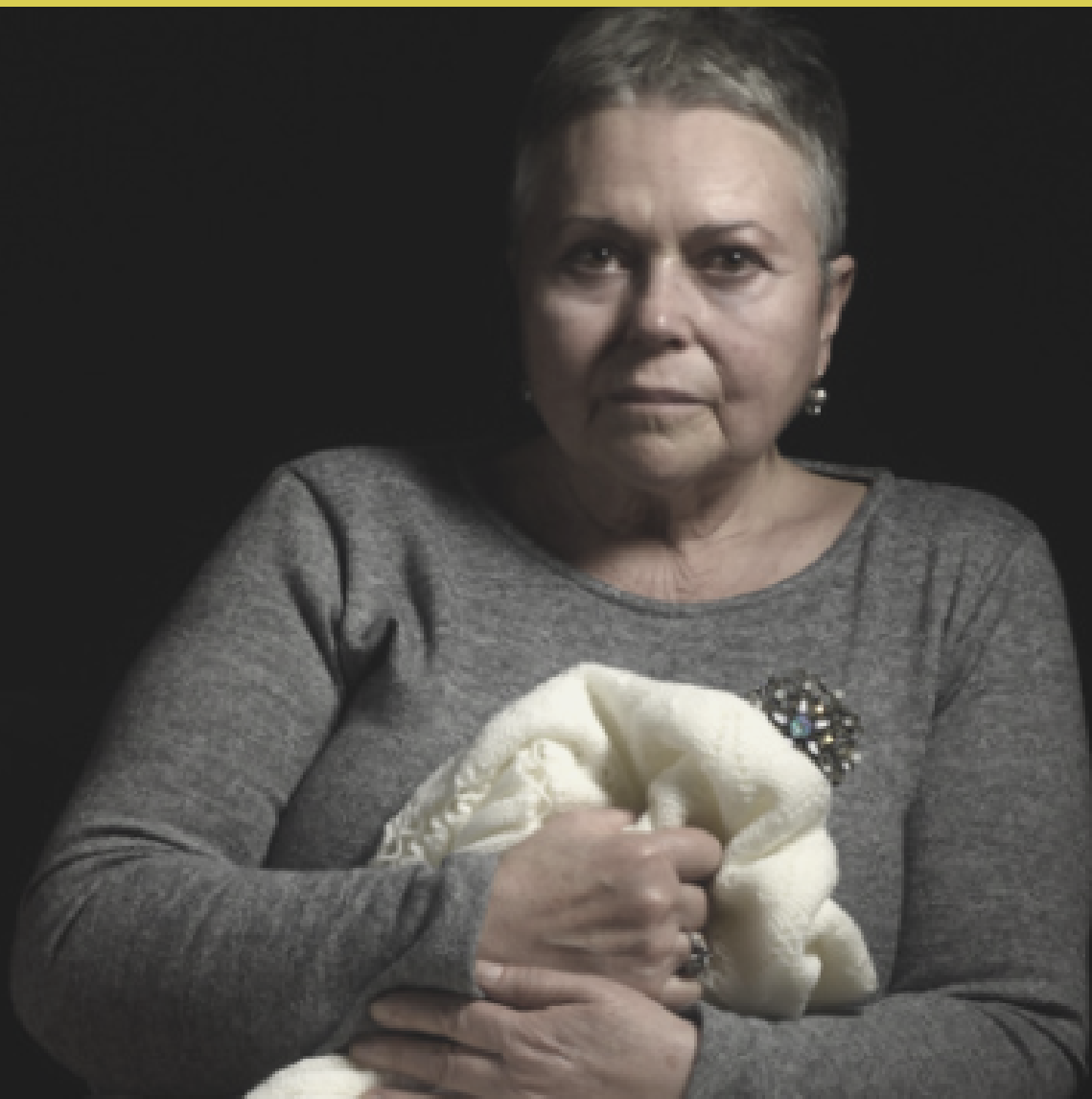
Fotografía de Pedro Lange-Churión para la exposición Duerma en ti (Centro del Carmen, Valencia, 12 de marzo-2 de junio, 2019).

La dictadura chilena también significó el total retroceso de los cambios impulsados por el gobierno de la Unidad Popular y la férrea implementación del neoliberalismo, para lo cual un grupo de asesores económicos fueron enviados por el régimen a formarse en Estados Unidos con el objetivo de familiarizarse con los principios de este paradigma capitalista.