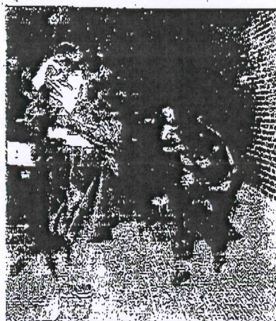
Los bomberos hicieron un duro trabajo.