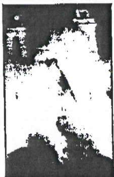
La hoguera de San Antonio